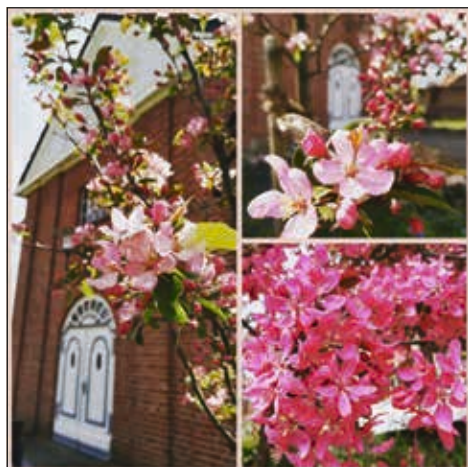
Collage: Chantal Graf