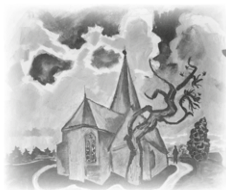
„Kirche“ Otto Pankok 1926