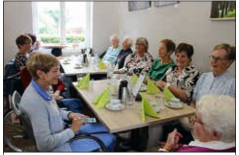
2025 bei Regenwetter

Im Juli treffen wir uns wieder im Café Lühlerheide und verbringen einen gemütlichen Nachmittag bei Kaffee und Kuchen.