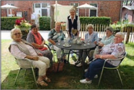
2023 bei Sonnenschein